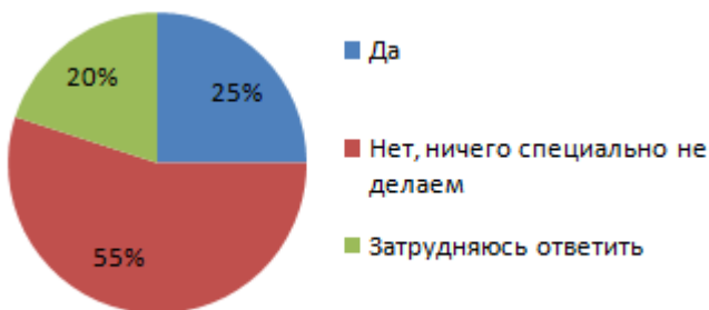
Рис. 4. Наличие специальных действий по привлечению и мотивированию талантливых сотрудников