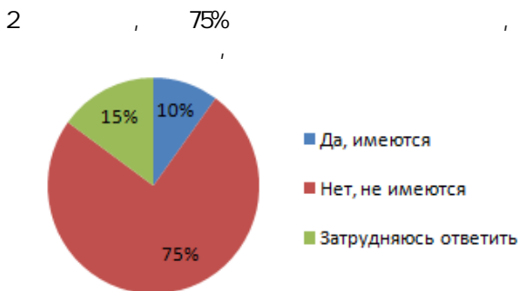
Рис. 2. Сотрудники, подающие новые идеи развития