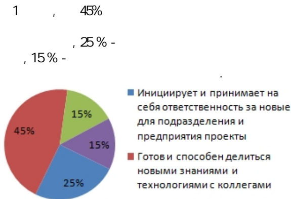
Рис. 1. Наиболее значимые признаки талантливого сотрудника