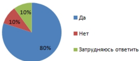
Рис. 6. Необходимость создания системы управления талантами на уровне всей отрасли и ее распространение на все предприятие