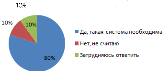
Рис. 5. Необходимость создания системы управления талантами